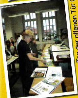
Tag der offenen Tür 08