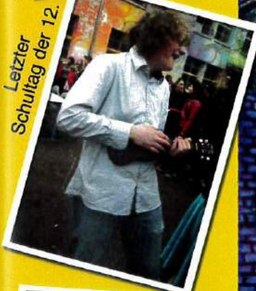
Leizter Schultag der 12.