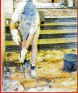
Sanierung im Haus 1